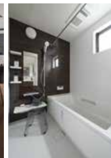
| Bath |