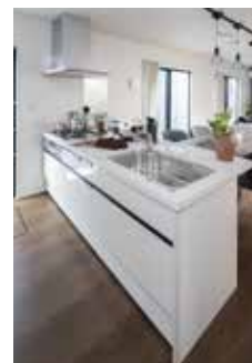
| Kitchen |