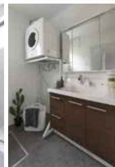
| Powder Room |